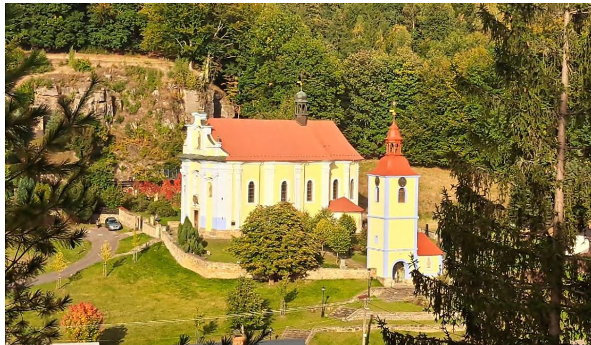
Horní Prysk - kostel sv. Petra a Pavla s obnovenou zvonicí - říjen 2023