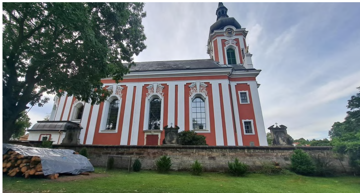
Arnoltice - kostel Nanebevzetí Panny Marie - obnovená fasáda a okna severní strany lodi - září 2023