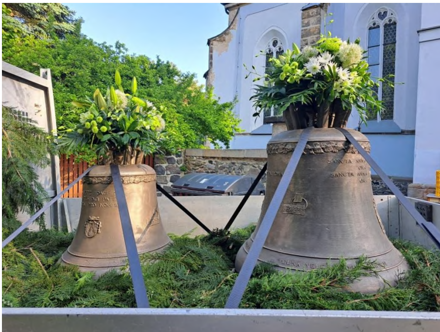
Jedlka - kostel sv. Anny - nové zvony sv. Anna - 403 kg a sv. Jáchym - 200 kg v den svěcení dne 27. 5. 2023