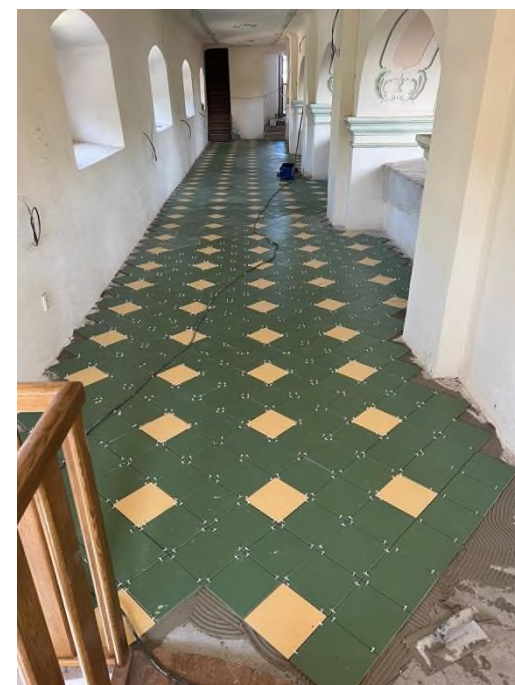
Verneřice - kostel sv. Anny - nové podlahy oratoří - severní oratoř - srpen 2023