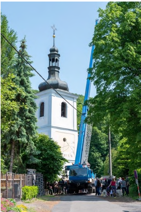
Jedlka - kostel sv. Anny - svěcení nových zvonů 27. 5. 2023