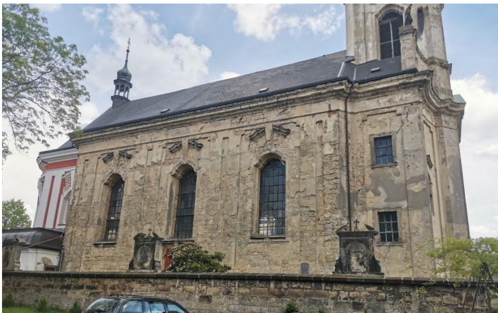
Arnoltice - kostel Nanebevzetí Panny Marie - pohled na havarijný stav omítek - severní strana lodi - červen 2021