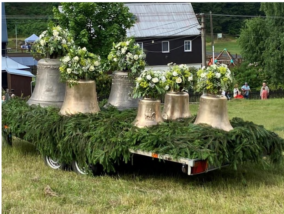
Horní Prysk - nové a darované zvony z farnosti Schwabach u Norimberka - 24. 6. 2023