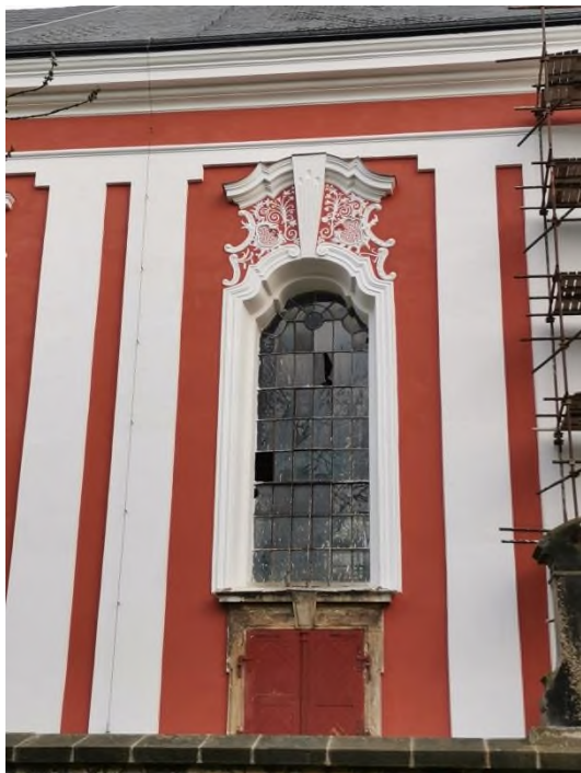
Arnoltice - kostel Nanebevzetí Panny Marie - obnova oken - severní fasáda - prostřední okno v havarijním stavu - září 2023