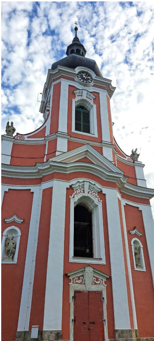
Kostel Nanebevzetí Panny Marie - pohled od západu po opravě fasády - říjen 2023