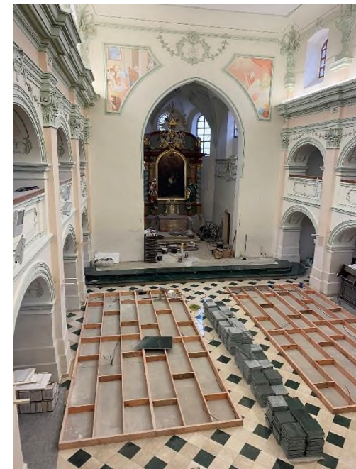
Verneřice - současný pohled do interiéru s obnoveným hl. oltářem sv. Anny – únor 2024