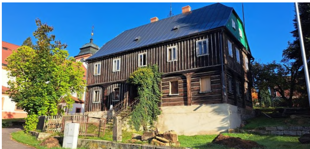
Jetřichovice - dokončená oprava statiky farní budovy - květen 2023