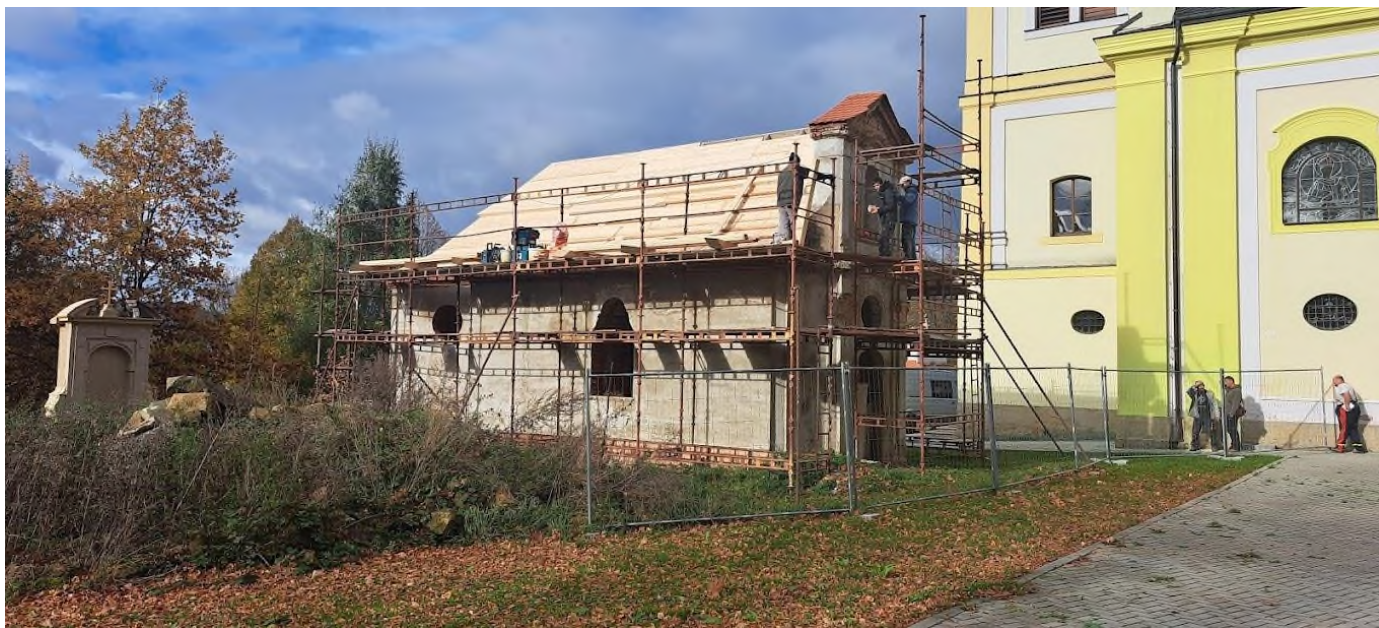
Markvartice - obnova ruiny kaple sv. Kříže u kostela sv. Martina v Markvarticích - současný stav - 2023