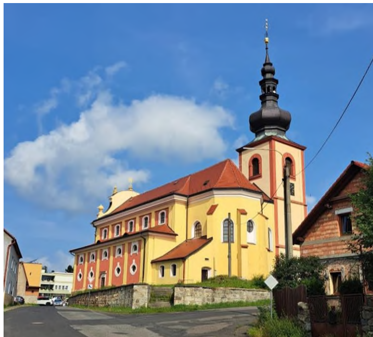
Verneřice - kostel sv. Anny - pohled od jihovýchodu - 2022