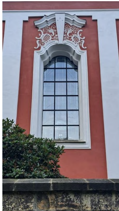
Arnoltice - obnova oken - severní fasáda - první okno vpravo v hlavní lodi - září 2023