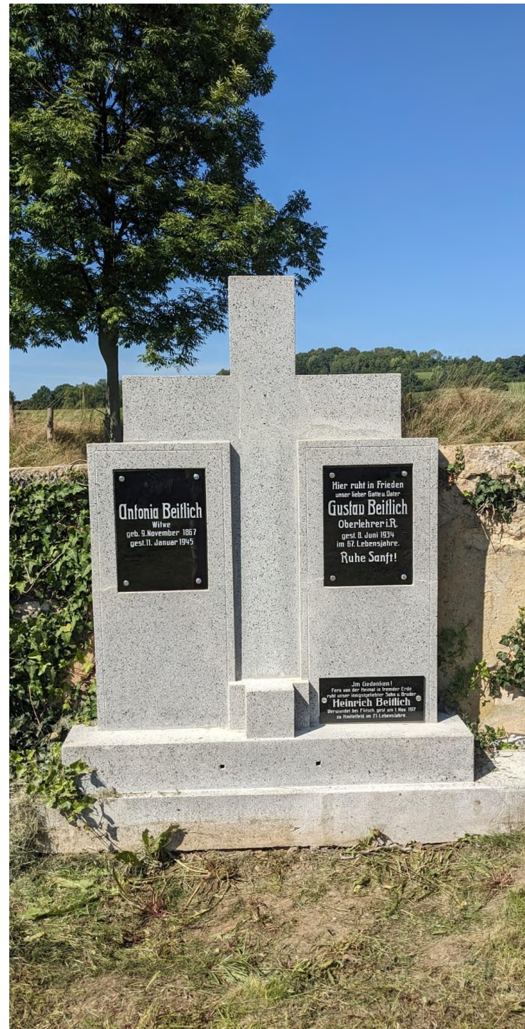
Kerhartice - hřbitov - nově opravený hrob Familie Beitlich - srpen 2023