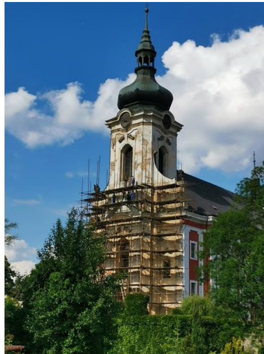
Arnoltice - kostel Nanebevzetí Panny Marie - oprava průčelí a věže - stavba lešení - červen 2022