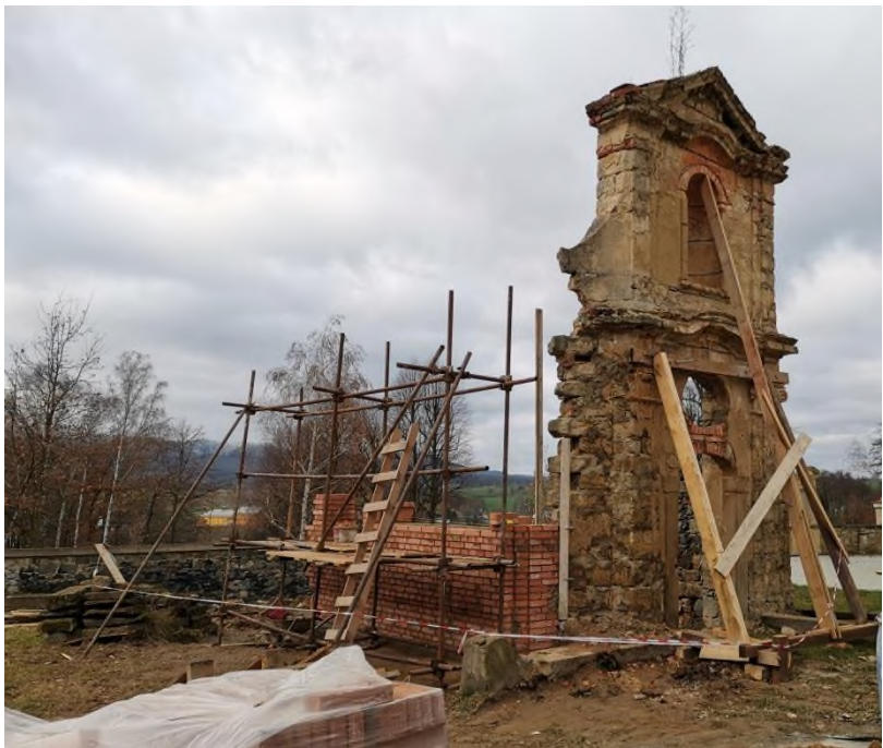
Markvartice - obnova ruiny kaple sv. Kříže u kostela sv. Martina v Markvarticích - 2020