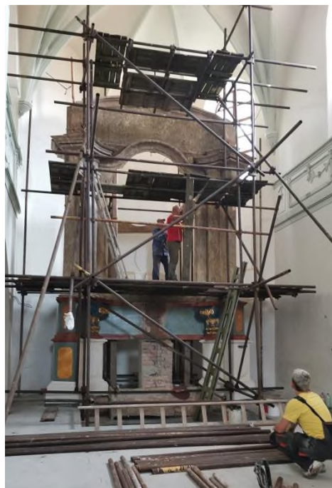
Verneřice - kostel sv. Anny - obnova hlavního oltáře sv. Anny - srpen 2022