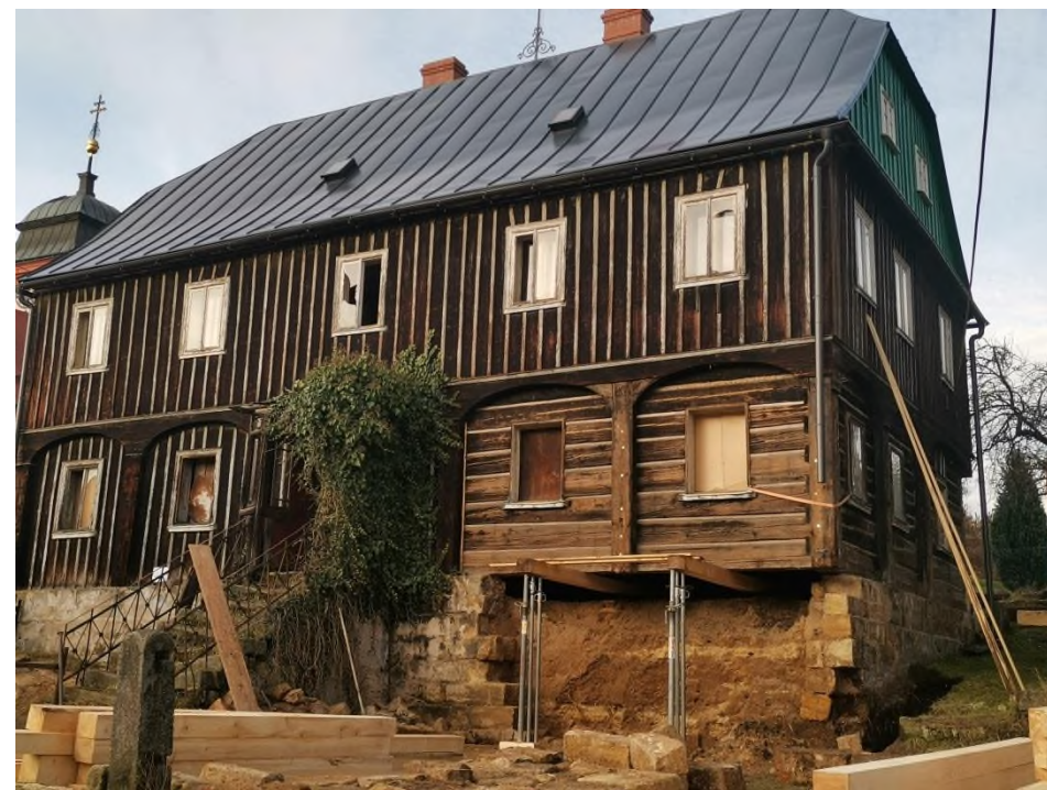
Jetřichovice - oprava statiky farní budovy z roku 1787 - 2022