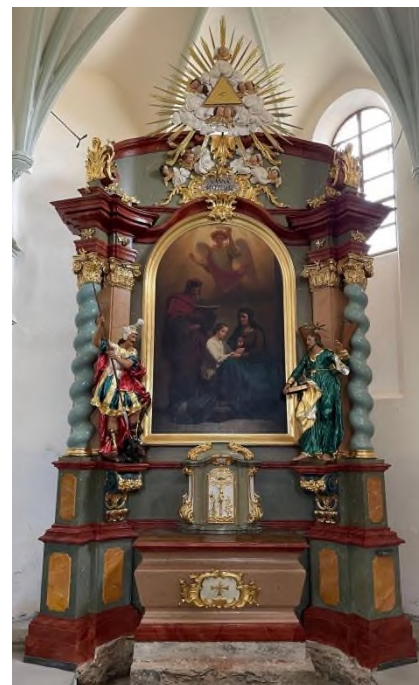
Verneřice - hlavní oltář sv. Anny - současný stav po restaurátorském zásahu - srpen 2023