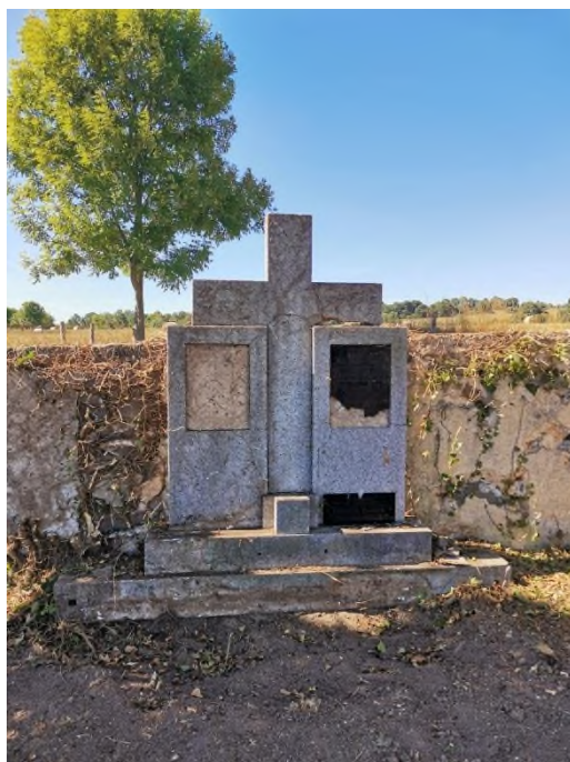
Kerhartice - hřbitov - Hrob Familie Beitlich osvobozený z křovi a břečťanu - srpen 2022