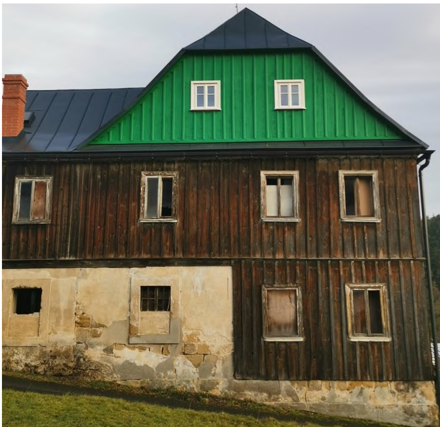
Jetřichovice - oprava farní budovy z roku 1787, postavené pro prvního jetřichovického kněze - pohled od západu - 2022